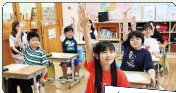
意欲的に発言しようとする6年生

今後も、一人一人の気付きや発想を生かしながら主体性を育み、学校教育目標の実現を目指してまいります。