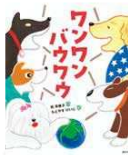
【出版】講談社 【作】乾柴里子【絵】もとやすけいじ