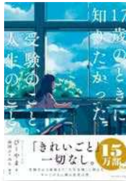
【出版】ダイヤモンド社 【著者】ぴーやま