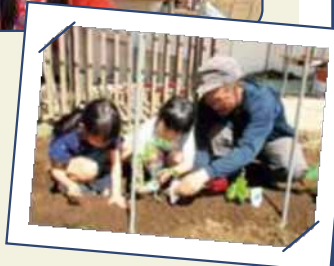
野菜を植える2年生