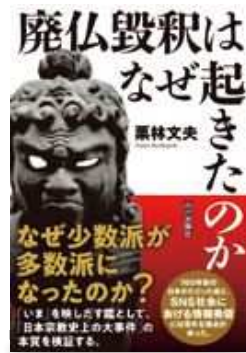
【出版】山川出版社 【著者】栗林文夫