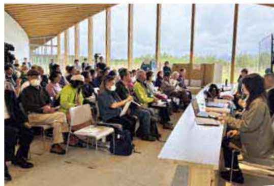
▲有識者の話に耳を傾ける参加者

会場には約60人の参加者が集まり、震災の記憶をどのように未来へ繋ぎ、語り継いでいくかをともに考える、貴重な場になりました。