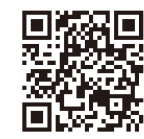
南阿蘇村電子図書館

お問い合わせ 図書室 0967(65)8581 教育委員会 0967(67)1602