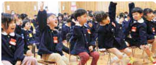
元気いっぱい返事ができました