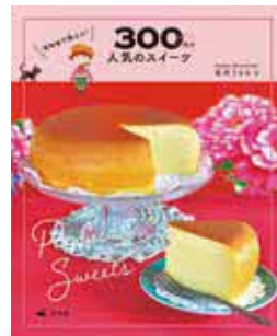
【出版】汐文社 【著者】宮沢うらら