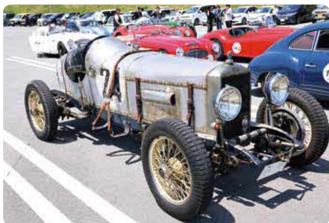
1928年に製造された車両

イベントは2日間にわたって行われ、初日は熊本市内を出発し、県南地域を巡ったのち、2020年に水害の被害を受けた人吉市で終了。2日目は震災で被害の大きかった益城町や西原村、本村などの県北地域を巡り、熊本市でゴールする走行ルートで実施され、1928年から1974年までに製