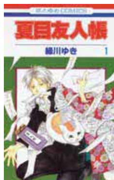
【出版】白泉社 【著者】緑川ゆき

【お知らせ】 LOOPみなみあそ図書室では、毎月テーマに合わせた「展示コーナー」を設置しています。6月のテーマは、「雨の日に浸る物語」と「心と体を整える発酵食品」です。梅雨はおうち時間が長くなる季節。しっとりと読書を楽しんだり、自家製の発酵食に挑戦したりして、室内での時間を豊かに過ごしてみませんか？ 気分転換に、ぜひ図書室へお越しください。