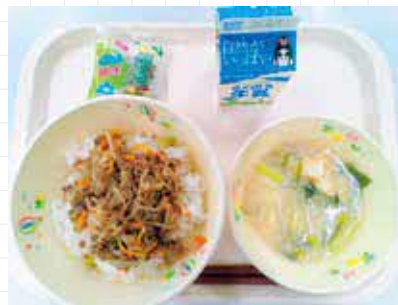
5月に提供されたあか牛そばろ丼