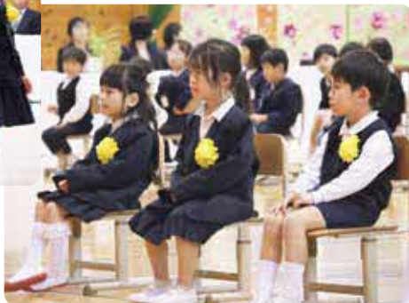
先生の話真剣に耳を傾けていました

■各小学校の入学人数 ・白水小学校 13人 ・久木野小学校 19人 ・南阿蘇西小学校 11人 白水小学校では上級生と保護者が見守る中、真新しい標準服や上履きを身に着けた1年生が緊張した表情で入場点呼では大きな声で返事をし、後ろを向いてお辞儀をしました。式後には教室で教科書など受け取り、嬉しそうな表情を見せていました。