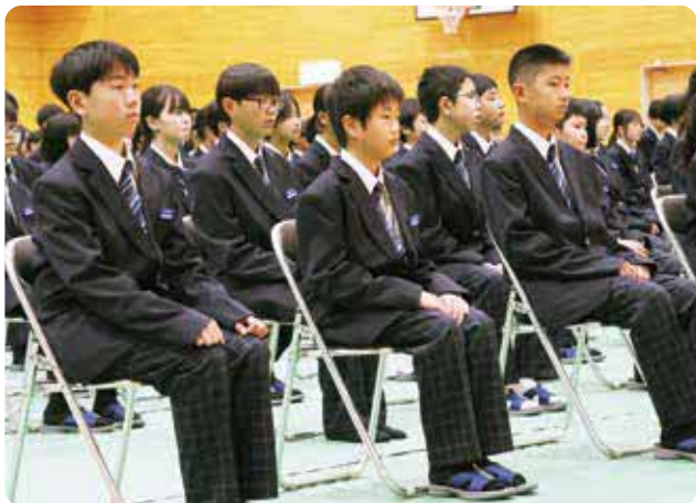
背筋を正して校長の話を聞く新入生

■各小学校の入学人数 ・白水小学校 13人 ・久木野小学校 19人 ・南阿蘇西小学校 11人 白水小学校では上級生と保護者が見守る中、真新しい標準服や上履きを身に着けた1年生が緊張した表情で入場点呼では大きな声で返事をし、後ろを向いてお辞儀をしました。式後には教室で教科書など受け取り、嬉しそうな表情を見せていました。