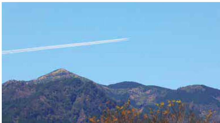
▲あそ望の郷くぎのから見たブルーインパルス

「熊本地震10年 復興そして未来へ」をテーマに6機が力強く空を飛び、震災ミュージアムKIOKUやあそ望の郷くぎのでは多くの人が空を見上げてブルーインパルスに見入っていました。