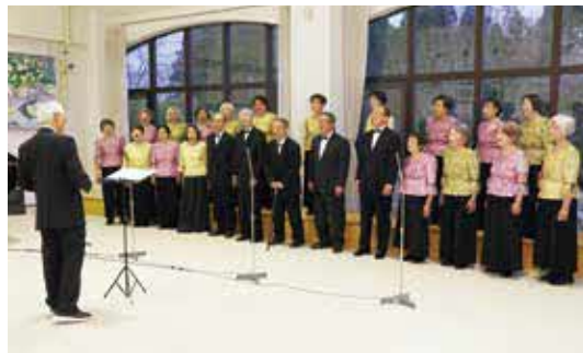
▲「大地の讃歌」を大切に歌う歌桜会のメンバー

地震で被災したメンバーもいらっしゃいますが、地震後は歌を通して村を元気にしようと精力的に活動を続けてきました。その思いが繋がり、4月には、全国放送で歌唱やインタビューを受けられる映像が放映されました。現在も毎週金曜日の午前10時から2時間、久石にある如水館阿蘇分館で練習に励まれており、これからもイベントなどで歌を歌い続けていかれます。