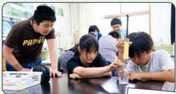
協力して理科の実験を行う6年生

今年度の全校児童は127人。自他の人権を尊重し合う授業づくりや人間関係づくり、環境づくりを重視した「あったか学校」づくりを長年継続しています。今年度は「元気と笑顔」があふれる学校を目指し、学校のリーダーとして、6年生には児童の主体性を伸ばすためのミッションが与えられています。具体的には6年生が考案した「挨拶じゃんけん」を全校児童に呼びかけ、挨拶や1年生との交流を積極的に行い、笑顔の輪を広げています。また、4年生以上の希望者による「文通プロジェクト」も継続します。昨年度は地域の人との手紙のやりとりのほかに初めて茶話会を実施し、表情が見える交流ができたと好評でした。このように、地域とのつながりや児童間のコミュニケーションを大切にし、学校教育目標の実現に向けて3つの資質・能力を意識して取り組み、「元気と笑顔」のあふれる学校づくりを進めていきます。