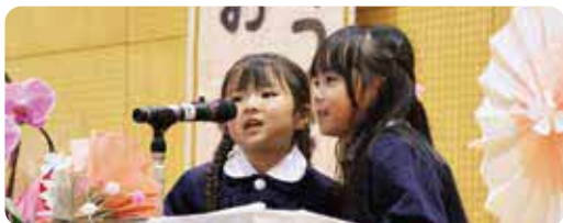
息の合った「はじまりのことば」

ちようよう保育園では新入園児を含む全園児が出席し、園児たちは1人ずつ名前を呼ばれて元気よく返事をしていました。