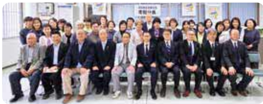
更生保護について確認を深めた参加者

犯罪や非行のない明るい社会を築くため、多様なボランティアが手を取り合い、南阿蘇の地から力強い一歩を踏み出した一日となりました。