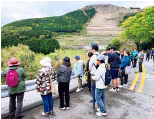
▲ガイドの案内で黒川を巡る参加者

4月25日と26日の2日間、旧長陽西部小学校・体育館を拠点に、当時の記憶をたどる「特別企画展」と、復興の歩みを感じながら集落を巡る「黒川ウォーク」が開催されました。