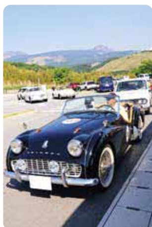
自然を満喫する参加者