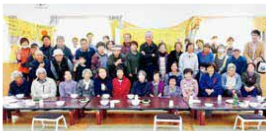
▲交流を行った参加者

4月19日、東下田公民館にて、村で活動を続けてきたボランティアグループ「NGO 魅来一笑顔届け隊」の主催で南阿蘇村復興祭が行われました。