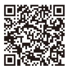
年度更新申告書書き方パンフレット