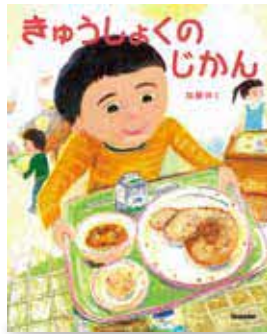
【出版】Gakken 【作・絵】加藤休三