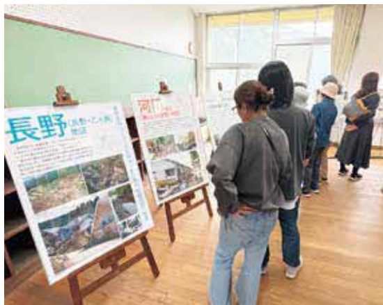
▲展示を見て回る来場者

当日、会場に訪れた人は展示を巡り、それぞれの団体の視点から学びや気づきを得ていました。