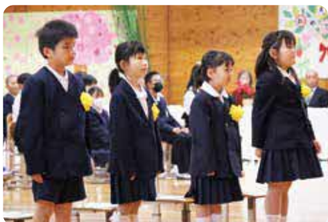
緊張した表情で返事をしました