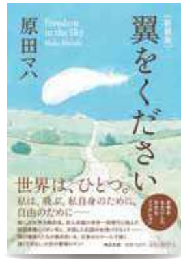
【出版】毎日新聞出版 【著者】原田マハ