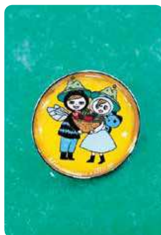
記念品として寄贈されたピンバッジ