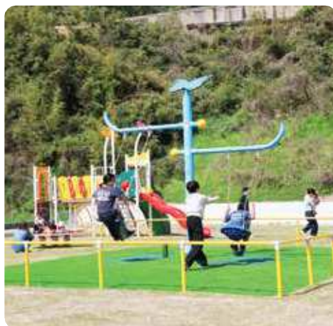
週末には多くの人たちが訪れていました