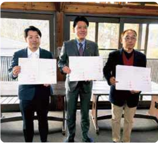
(写真左から) 日野取締役副社長、村長、古澤理事長

村では今後も、こうした企業などとの連携の輪を広げ、誰もが安心して暮らせる健康やかな地域づくりを推進してまいります。