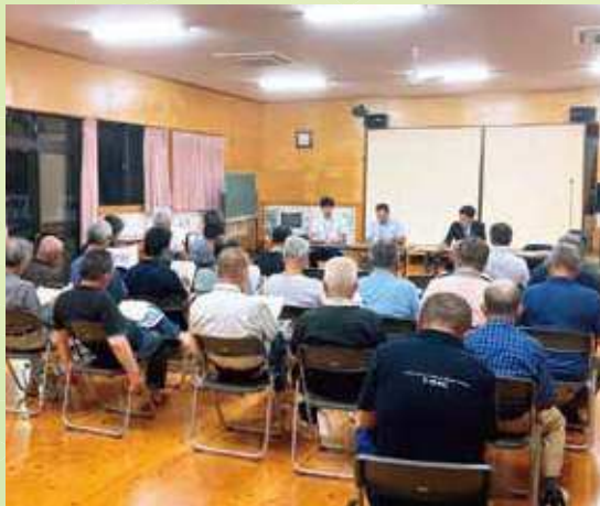
野焼き再開に向けた協議