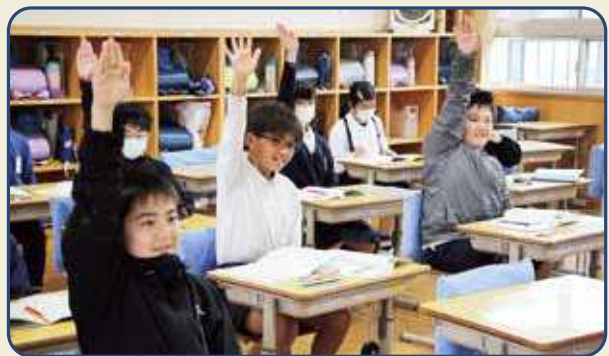
授業中積極的に挙手する5年生

今年度の全校児童は129人。「ふるさとが好き」という教育目標のもと、豊かな自然とあたたかい人々に囲まれ、未来に向かって全力でがんばることができる学校づくりが進められています。地域との交流も活発で、昨年6月には子どもたちの提案をもとに地域の皆さんと打ち合わせを行い交流会が実施されました。当日はフルーツ白玉作りに挑戦し、大好評でした。その他にも、祖父母・地域の参観日や米作り、プログラミング学習など、地域とのつながりを深める活動が盛んです。学校のホームページにも活動する姿がアップされており、アクセスも増加しています。