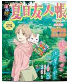
【出版】JTBパブリッシング