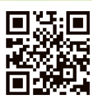
阿蘇グリーンストック HP

そのために、公益財団法人阿蘇グリーンストックでは、九州を中心に、全国からボランティアを募り、初心者研修会を義務付け、人手不足や高齢化によって、野焼きや輪地切りの持続が困難な牧野へ野焼き支援や輪地切り(防火帯づくり)活動に派遣しています。現在は約1,500人の会員が登録しており、さまざまな牧野にて活動の支援を行っています。