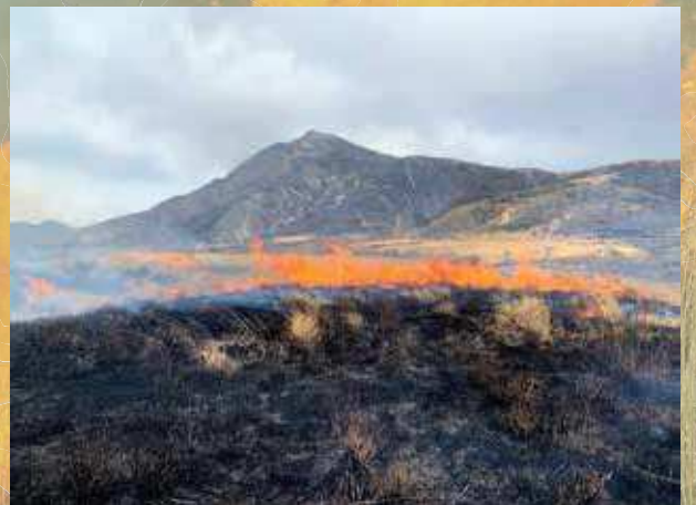
他地域での野焼き