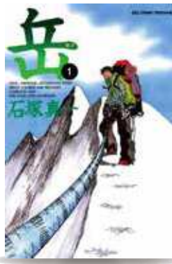
【出版】小学館 【著者】石塚真一

【お知らせ】 L O O Pみなみあそ図書室は、ゴールデンウィークも通常どおり開館しています。 5月6日(水)まで、本を借りた人を対象に「5周年記念ガラポン抽選会」を開催中です。ぜひこの機会にご利用ください！ 本の在庫確認やご予約は、お電話でも承ります。お気軽にお問い合わせください。