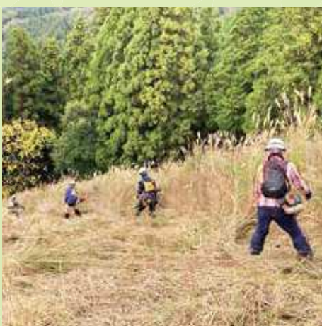
輪地切りを行うボランティア