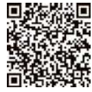
自動車税についてのQ&A