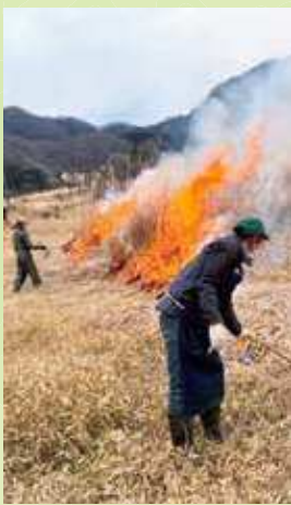
中郷竹崎牧野での実地研修

令和8年2月には、3回目となる研修会が開催されました。午前の実地研修は計7人が参加され、中郷竹崎牧野をお借りし、実際の火付けを実施しました。参加者は真剣な表情で受講されていました。また既に認定を受けている4人は今後も対象牧野において現地研修を継続し、草原維持活動に携わっていただきます。加えて参加者の心理的安全性を担保するために、万が一事故が発生した場合の保険・補償制度の見直しなども実施する予定です。