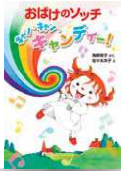
【出版】ポプラ社 【さく】角野栄子【え】佐々木洋子