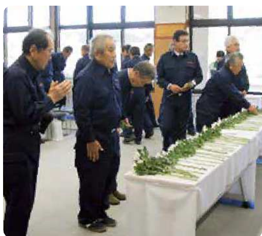
参列者による献花