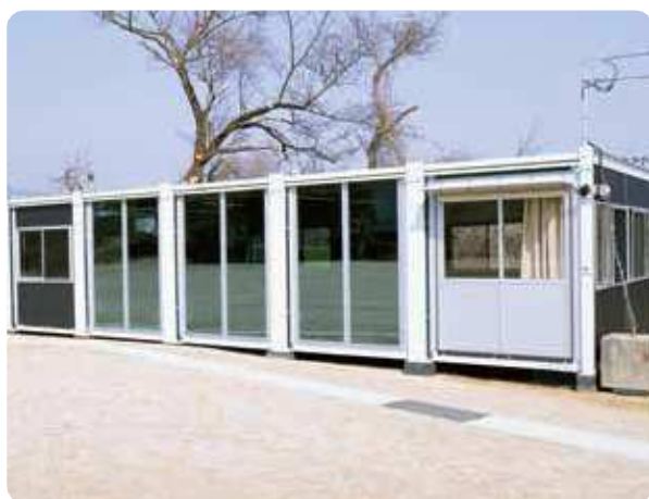
児童を受け入れるユニットハウス