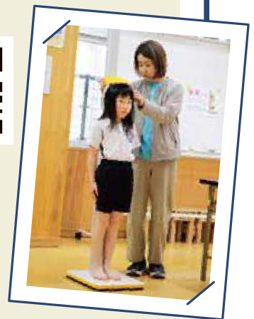
身体測定で身長を測る2年生。 大きくなったかな？