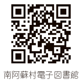
南阿蘇村電子図書館

〈問い合わせ〉 図書室 ☎0967(65)8581 教育委員会 ☎0967(67)1602