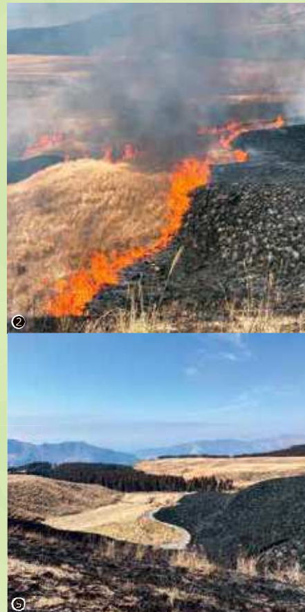
① 火入れをするベテランの人々 ② 野焼き最中の草原