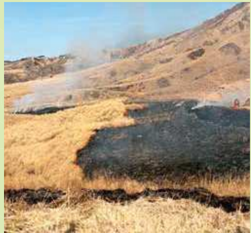
少しずつ延焼する草原