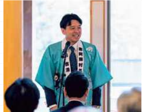
木の香湯オープンセレモニーで挨拶をしました

今回は皆さんの心と身体を癒し、健康づくりにもつながる村の温泉施設について、現状と今後の展望をお伝えします。