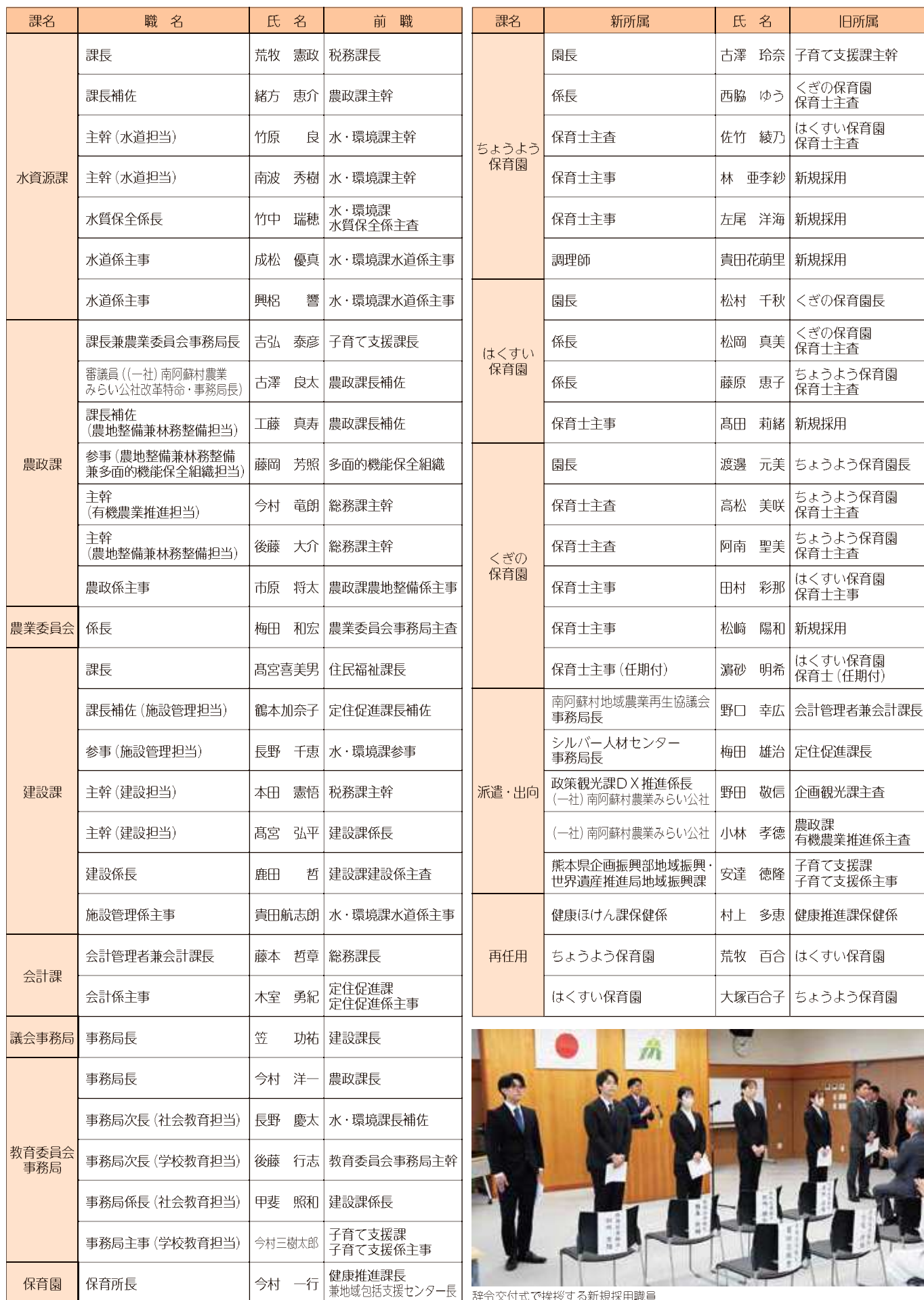
辞令交付式で挨拶する新規採用職員