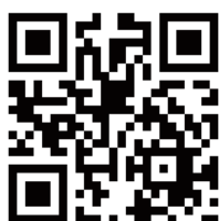
ご予約専用 QR コード

【お問い合わせ】 熊本県地域無料就労相談窓口事業事務局 (株式会社 Fine プロデュース内) e-mail : contact@jobcafe-branch.com