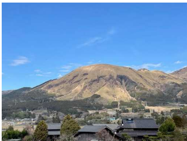
図 3-7 夜峰山

久木野宮神社は、健甞龍命・阿蘇都姫命を祭神とし、久木野の地名発祥の地とされています。これは、長陽地区における夜峰伝説で、阿蘇都姫命が妊娠した際、お産の姿を隠すために一夜で築いたのが「夜峰山」で、夜峰山が崩れないよう釘を打ったのが現在の久木野宮であるという神話に基づくものです。他にも現在の「立野」の地名が、健甞龍命が外輪山を蹴破った際に尻餅をつき「立てぬ」と言ったことに由来するという神話や、江戸時代に編さんされた肥後国誌に「白川乾藪堂というところに、阿蘇大御神の御足跡石がある」と記されている白水地区の巨石（阿蘇大御神足跡石）など、南阿蘇村の各地に、こうした阿蘇神話との関わりが認められる場所が多く残されています。