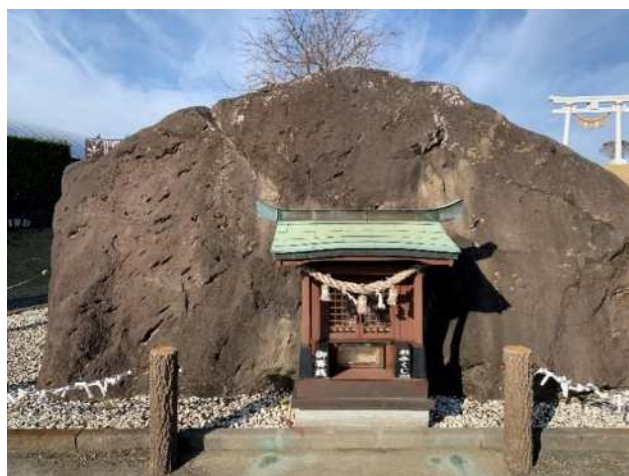
図 3-8 阿蘇大御神足跡公園（白川区）