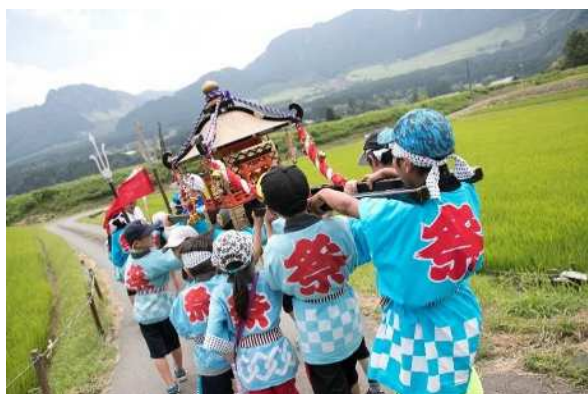
図 3-9 卯添阿蘇神社夏祭り（喜多区）

熊本地震によって破損した石造物も多くありますが、地域住民によって修復・再建されるなど、現在も人々の心の拠り所として、またコミュニティの場として重要な役割を持っています。