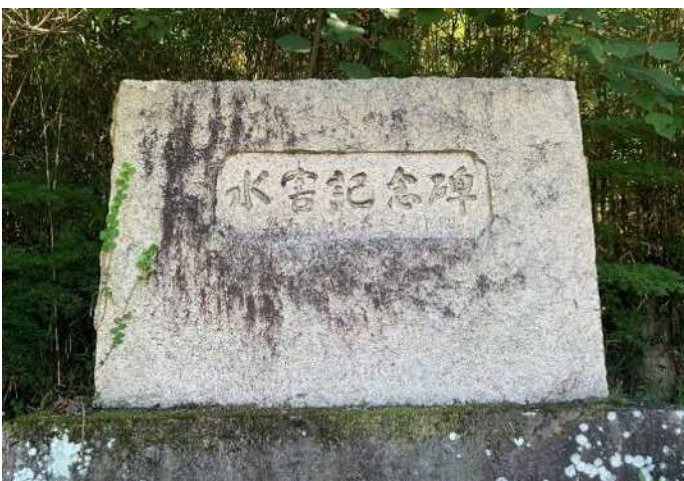
図 3-6 水害記念碑（加勢区）