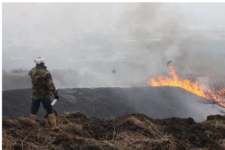
図 3-3 野焼きの様子（白川牧野）

草原は、日本書紀（720年）に「野は広く人家なし」とあり、そのころ既に広い草原があったことが示されています。草原は、低地の集落が野焼き、採草、放牧といった行為を行うことによって長年維持されており、冬季の貯蔵飼料とするための草小積みや、害虫駆除や土地の保水力の維持など多面的な機能を果たす野焼きは季節ごとの風物詩となっています。