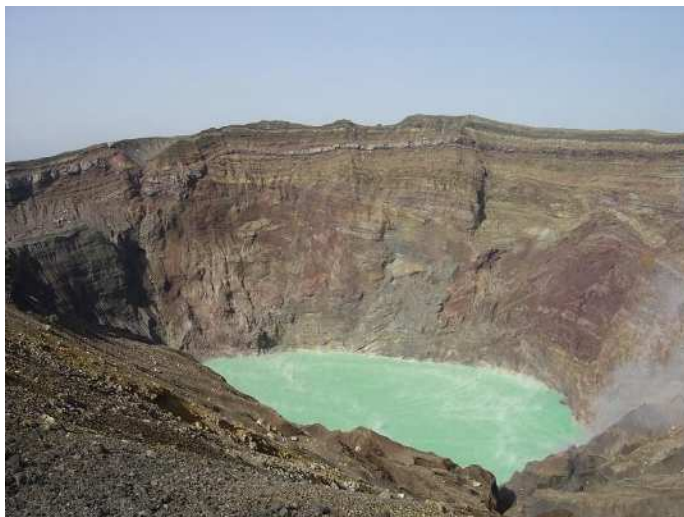
図 3-5 中岳中央火口丘（火口）

加えて、昭和 28 年(1953 年)に起きた 6・26 水害では、死者・行方不明者 65 人、家屋被害 387 戸という甚大な被害を受けており、村内各地に記念碑が残されており、災害の記憶を現在に伝えています。