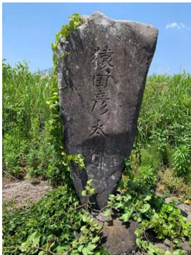
図 3-10 猿田彦大神（吉田区）