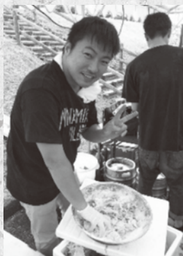
唐揚げ担当の穴見部員

初の試みとなった、綿菓子やぷよぷよボールすくいにも子どもたちが列を作り、休む暇もないほどの大盛況でした。