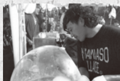
綿菓子と闘い続ける長野部員