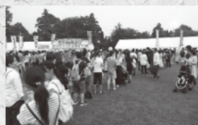
あか牛の串焼きの行列

来年も出店することが出来るかは分かりませんが、これから南阿蘇村の魅力や元気を村外の方々にもPRしていきたいと思えます。