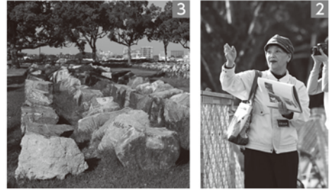
1_複数箇所です石垣が損壊(写真は戌亥櫓) 2_修復中の熊本城を案内するボランティアガイド 3_同じ位置に復元するため整理された崩れた石垣