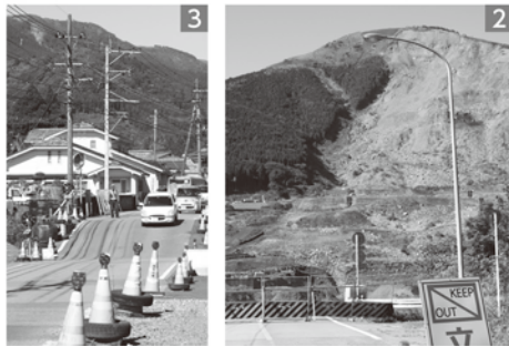
1_倒壊した拝殿(阿蘇神社) 2_崩落した阿蘇大橋と土砂崩れの跡(南阿蘇村) 3_地盤沈下で寸断された道路も現在は通行できる(阿蘇市)