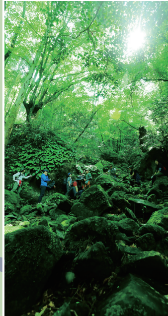
苔に覆われた、神秘的な空間