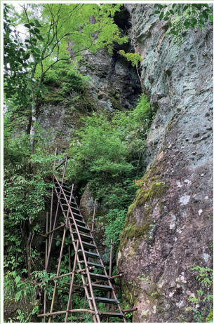
招き猫洞窟へ続く 鉄階段や鎖場