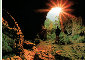
巨大な洞門・男風穴