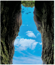
幸せを呼ぶ 招き猫洞窟