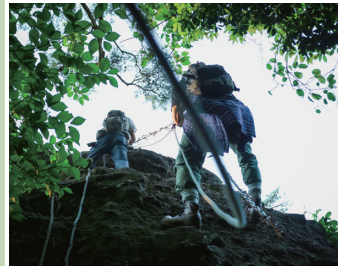
女風穴からロープ降下