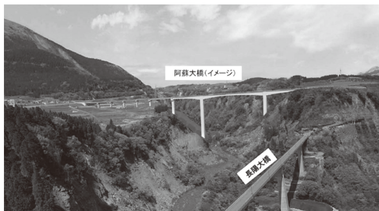
阿蘇大橋の架け替えイメージ写真

国道325号阿蘇大橋の橋梁形式「PC3径間連続ラーメン箱桁橋」に決定 国が直轄事業として災害復旧事業を進めている「国道325号阿蘇大橋」については、これまで専門家による技術検討会を設置し、架け替え位置や橋の構造について検討を進め、7月29日(金)、専門家の意見を踏まえ、最も施工が早くでき、安全性の高い「阿蘇長陽大橋」と同じ形式の「PC3径間連続ラーメン箱桁橋(略称PCラーメン橋)」に決定しました。