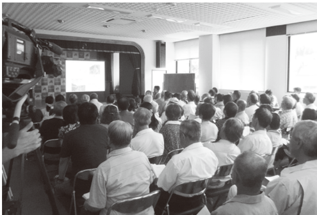
各担当から説明を聞く参加者の皆さん