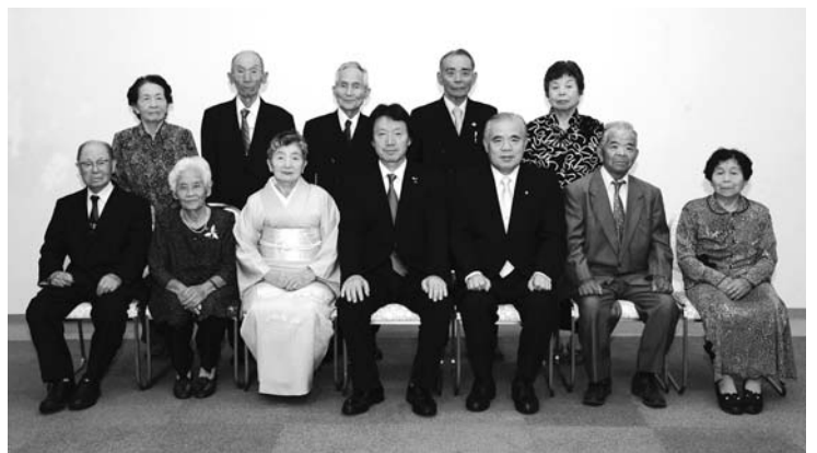
長陽地区ダイヤモンド婚夫婦の皆さん