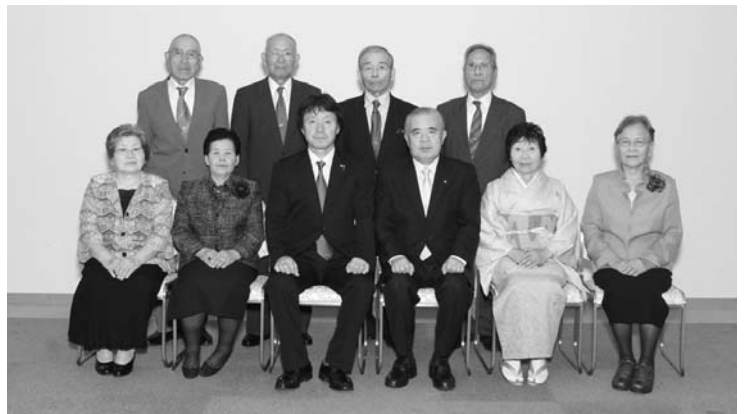
久木野地区ダイヤモンド婚夫婦の皆さん