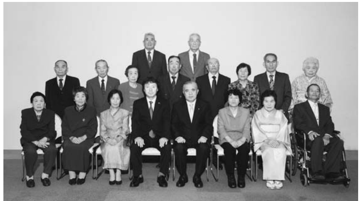
白水地区ダイヤモンド婚夫婦の皆さん