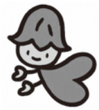
熊本県人権啓発キャラクター「ココロ」