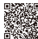
マイナポイントの予約

住民福祉課窓口では、マイナポイントの予約支援を行っています。マイナンバーカードと申請時に設定した利用者証明用4桁のパスワードをお持ちいただければ、その場でマイナポイントの予約手続きのお手伝いをします。 住民福祉課 Tel (67) 2702