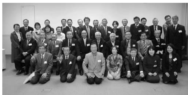
関東村人会の皆さん