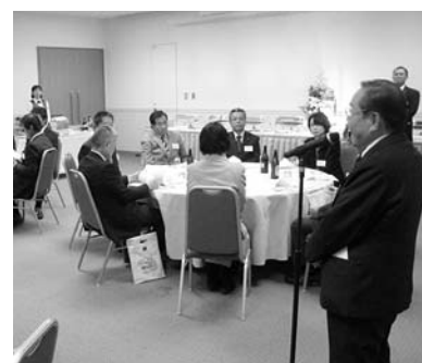
懐かしい話しで盛り上がる参加者