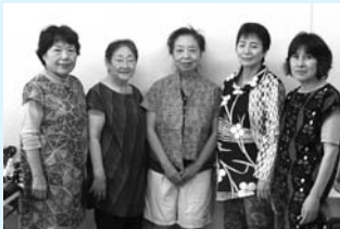
手作りの洋服を着た縫ぬいメンバー

縫物が好きな会員が集まり始めた「縫ぬいクラブ」。針を持つことも何十年ぶり……。お互い手を借りながら、アイデアを出し合いながら、毎回楽しく作品作りに取り組んでいます。古くなった和服をリメイクした洋服やバッグ、端切れやちりめんを使って小物やドンブリのブローチ、風船カズラの種を使った苦難のサルも作りました。縁起物として玄関などに置くと良いと言われ、贈りものに喜ばれています。また浴衣やハンカチでコースターも作りました。「私も作ってみたい!」と思った方は、毎週火曜日、午前10時から長陽中央公民館で活動していますので、お気軽に来てみてください。お待ちしております♪