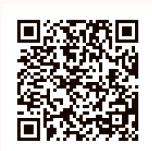
国税庁LINE 公式アカウントの 友だち追加はこちら

〈問い合わせ〉阿蘇税務署 TEL0967 (22) 0551 ※自動音声案内に従い「2」を選択してください。