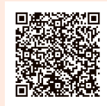
国税庁HP 確定申告書作成コーナー