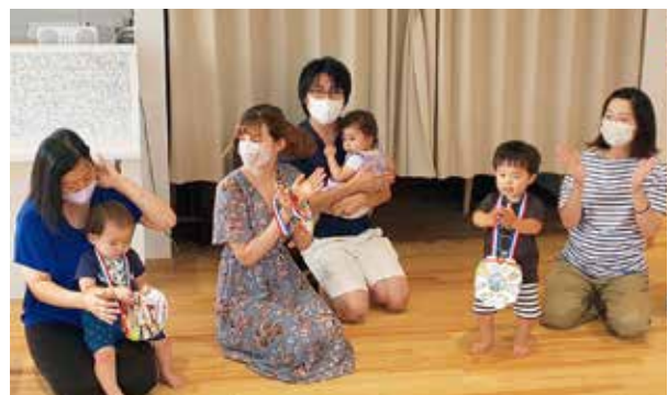
誕生日をみんなでお祝いしました!!