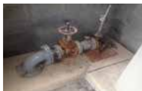
耐久年数を過ぎているポンプ設備