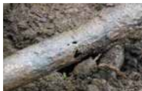
老朽化により孔食した水道管

水道事業は独立採算制のため、運営費や建設費は皆さんからいただいた税金ではなく、水道料金収入で賄わなければならないかもしれませんが、水道料金だけでは不足するため、毎年、必要な経費を企業債(借金)のほか、普通会計からの繰入金として補填しています。このような企業債や繰入金への大きな依存は、村財政の圧迫の要因の1つとなっています。その上、今後加入者の減少などによる上下水道料金収入の減少と施設更新費用の増大が見込まれるため、一層厳しい財政状況になっていくことが予想されます。