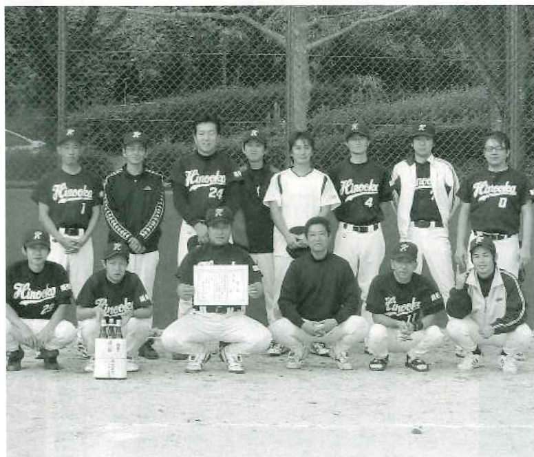
職場対抗ソフトで優勝した陽ノ丘チーム