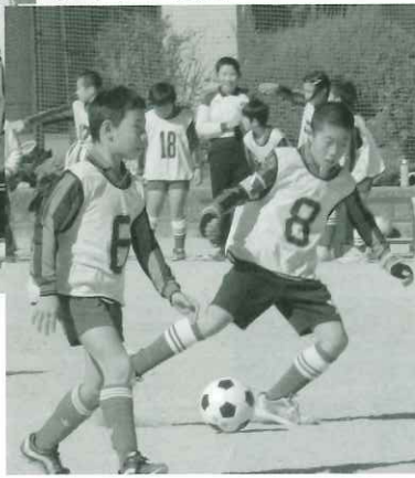
相手陣内に攻める両併小チーム (Dクラス優勝)