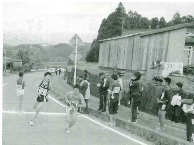
黒川中継所をトップでタスキを渡す南阿蘇村Aチーム

第31回阿蘇郡市町村対抗駅伝大会が11月18日阿蘇市役所をスタート、高森町役場をゴールとする14区間45・8キロで行われ、総合順位で南阿蘇村Aチームが2位に入賞するなど大健闘しました。