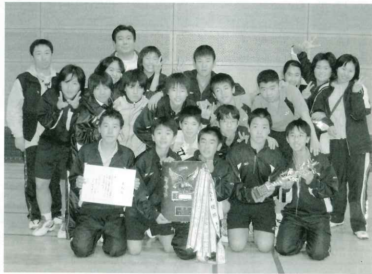
県新人戦で団体優勝した久木野中バドミントン部

11月17日、玉名市総合体育館において平成19年度熊本県中学生新人バドミントン大会が開催され、久木野中バドミントン部が男子団体の部で見事優勝の栄冠に輝きました。