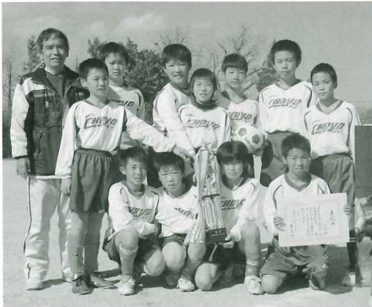
Aクラス優勝の長陽小チーム

第32回阿蘇郡市学童ミニサッカー大会が11月23、24日の両日、阿蘇市内の小学校グラウンドで行われました。本村からは各小学校より出場し、見事Aクラス(6年生以下)で長陽小学校が、Dクラス(常時女子2名以上出場)では両併小学校が古城小を破りそれぞれ優勝を飾りました。 又、長陽小学校はBクラス(5年生以下)も3位と大健闘しました。