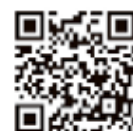
参加申込みページ