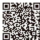
消費者庁特設サイト