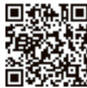
谷人たちの美術館HP