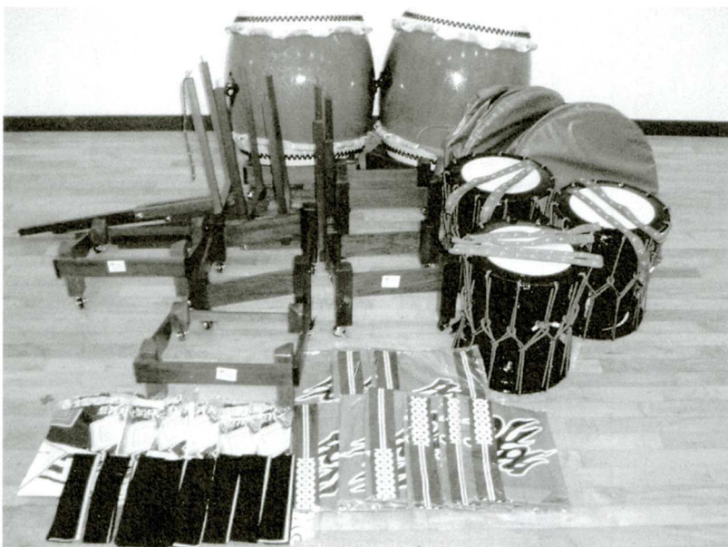
購入した太鼓一式

これまで、地域イベント、ボランティア活動(慰問)などの活動を行ってきましたが、今後、この新しい太鼓を活用し、さらに活発な活動が期待されます。