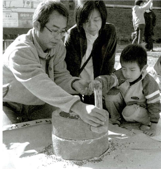
そば引き体験をする親子

11月23日南阿蘇村役場久木野庁舎隣の「そば道場」二帯で「新そばまつり」が開催されました。昨年は、ソバの不作で、中止されたため2年ぶりの開催となり多くの人で賑わいました。