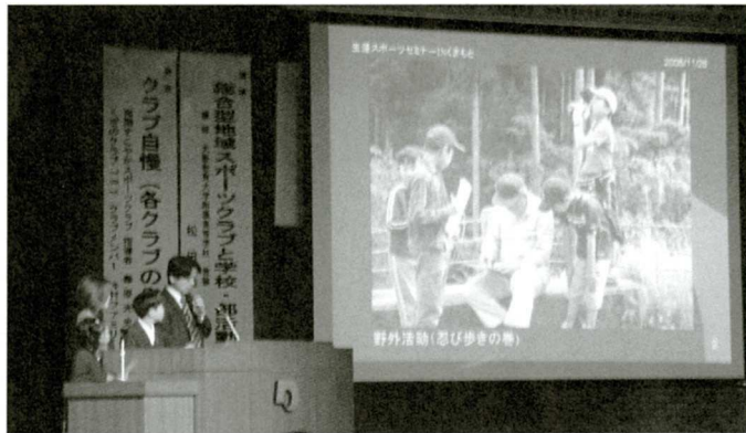
☆「体ほぐし」では継続的に自分の体に向き合いよりよい健康な体作り心作りに取り組んでいます!(写真下・右端)