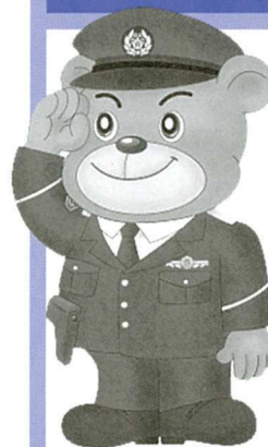
ぼく、ゆっぴーです