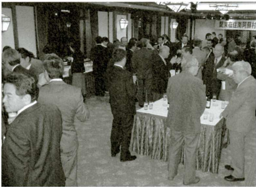
村人会の様子(関東村人会)

この会は、情報交換や同郷者相互の親睦を通して、村の観光や特産品を、村と村人会が連携してPRし地域振興発展を図ろうと開催されたものです。