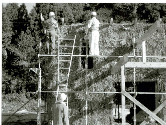
草（ブロック）を積み上げて、壁とします。