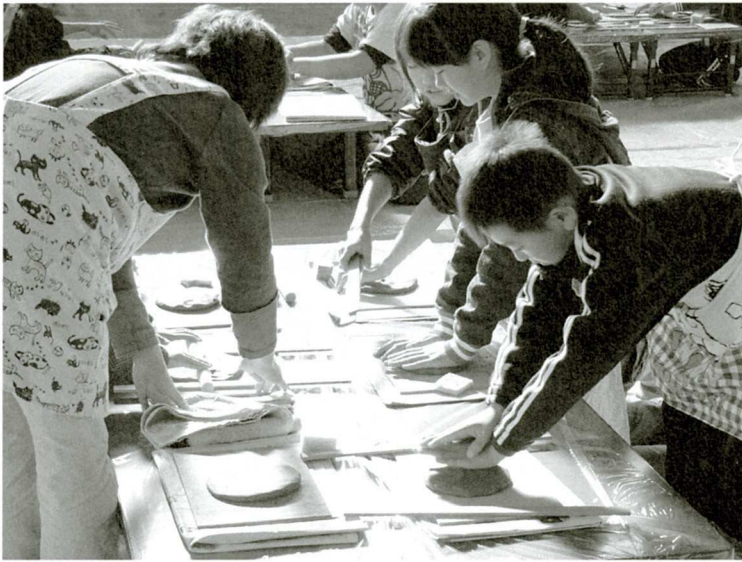
指導を受けるジュニアリーダー

参加した子どもたちからは、「出来上がりがどんなふうになるか楽しみ。」と感想の声がありました。作った作品は、焼成してクリスマス前に完成する予定です。