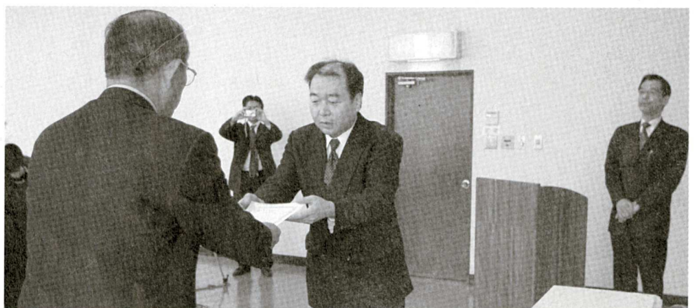
組協社長（右）に認定書を手渡す飯法師旧久木野村長

同校は、久木野本校でのスクーリングや野外活動を通じて進学や資格取得などを支援するのが特徴で、初年度は約200～300名の入学者を見込んでいます。 「この学校を創っていききたいです。」と抱負を語りました。