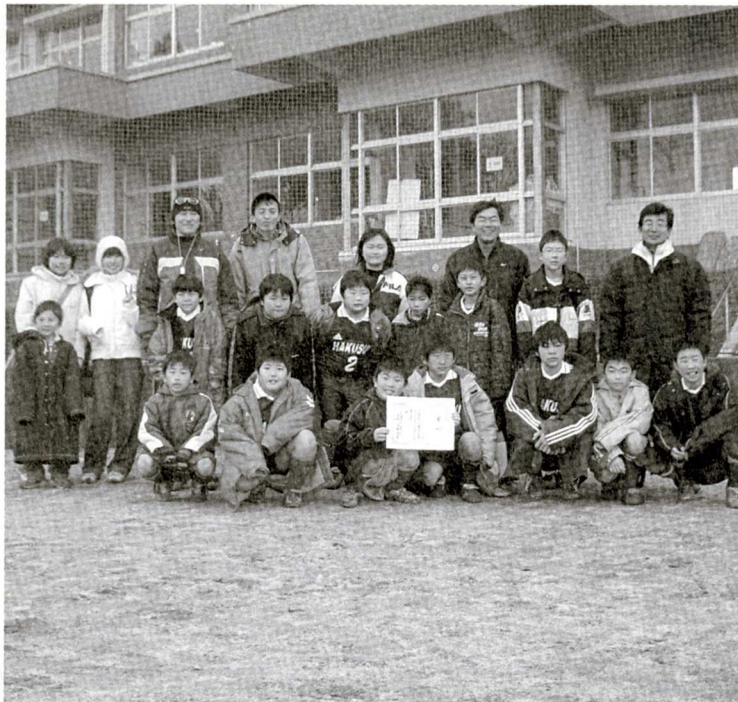
白水小サッカー部Aチームのみなさん