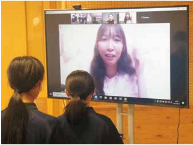
ミャンマーの同年代の女性とオンラインで交流する高森高校生

6月11日、高森高校でオンライン海外研修が実施されました。これは、南阿蘇村に新設されたアイデアITカレッジ阿蘇の支援により、高森高校の3年生がカンボジアとミャンマーの日本について学んでいる若者とオンラインで繋がり、互いの国での暮らしや文化を学ぶことを目的としたもので、現地の人々と交流することで英語を実践的に使用する貴重な機会となりました。