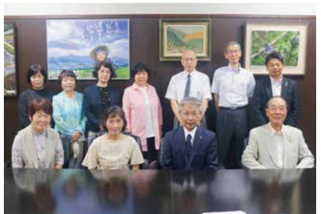
阿蘇地区保護司南部分会・村更生保護女性会の皆さん

7月の「社会を明るくする運動強調月間」に伴い、社会を明るくする運動の啓発を目的として、7月1日に役場村長室で総理大臣と熊本県知事のメッセージの伝達式がおこなわれました。