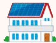
住宅の屋根に設置した10kW以上の太陽光パネル

現況地目が「山林」などの場合、地目が「雑種地(宅)」へ変更となるため税額が変わります。