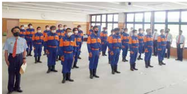
厳粛な雰囲気の中で開催されました

6月6日、役場大会議室にて南阿蘇村消防団の入退団式がおこなわれました。新型コロナウイルス感染拡大防止のため、昨年に引き続き規模を大幅に縮小し幹部(団長、副団長、分団長)のみ出席での開催となりました。