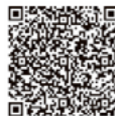
動画の視聴はこちら