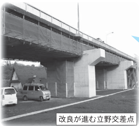
改良が進む立野交差点

阿蘇大橋拡幅に伴う水道管布設工費 【472万円】 萩尾配水池増設に伴う杭基礎工事 【730万円】