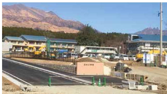
道路改良費(町後1号線) 2500万円