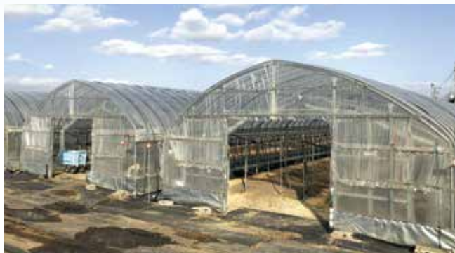
攻めの園芸…補助金(耐候性ハウスのイメージ) 2849万円