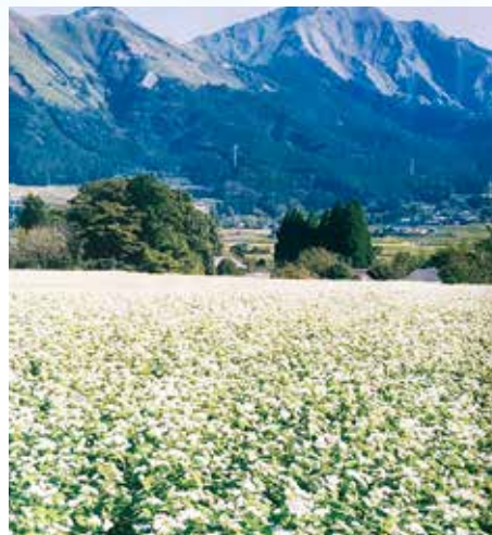
第三セクター貸付金 2000万円