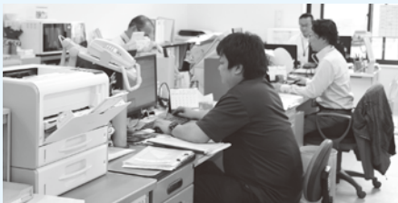
次世代定住課と協力し、まい進していきます。