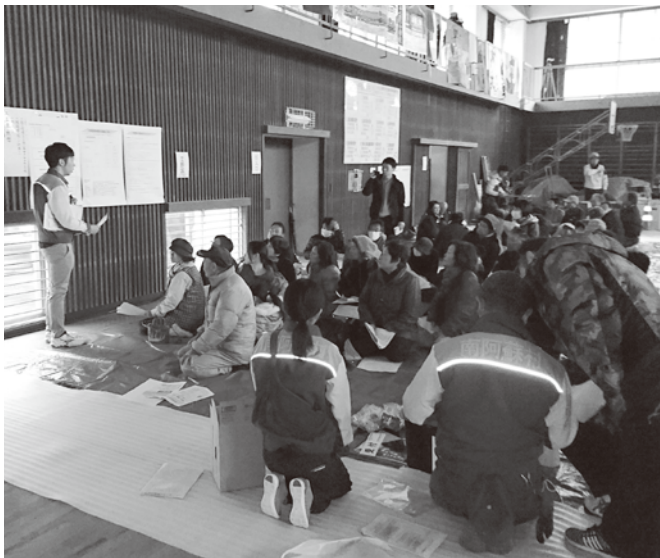
昨年の村防災訓練で参加者に避難所運営を説明する職員

これまでに4回の協議と昨年11月26日立野地区での防災訓練でマニュアルを検証するなどして完成しました。マニュアルは災害時にとる基本的な行動をまとめ、地域の実情に合わせて作り上げていく内容となりました。