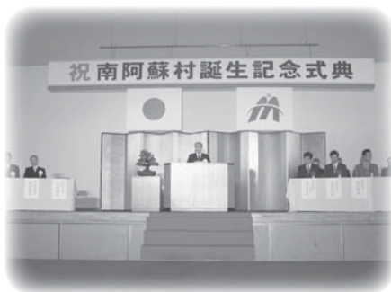
合併10周年記念事業